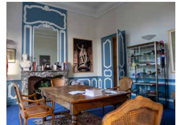
Bureau du Maire