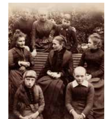
Avranchinaises posant devant l'objectif d'Alphonse Provost, dont les deux filles du photographe.

différentes mises en scène particulièrement recherchées. Sa famille, des enfants, des familles, le clergé local et de nombreux amis se sont fait tirer le portrait chez A. Provost qui ne manquait pas d'imagination et qui maîtrisait admirablement la technique photographique à une époque où cet art était encore peu démocratisé. Chaque photo apporte son lot de détails, sur l'art de vivre du moment. Les costumes, les accessoires de modes, les bicyclettes et les attelages, les scènes de ville et de bord de mer révèlent un monde aujourd'hui disparu avec une incroyable précision.