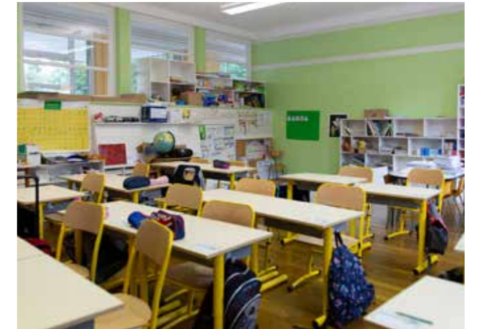
Classe de CE1 à l'école Pierre Mendès-France

Les bureaux du Centre technique municipal, situés dans l'ancien manège équestre de M. Burdelot au 28 rue de Changeons, connaissent eux aussi une cure de jouvence. Au programme : rénovation de la toiture par l'entreprise Chaperon, changement des huisseries et réaménagement intérieur des locaux par le service bâtiment du Centre technique municipal.