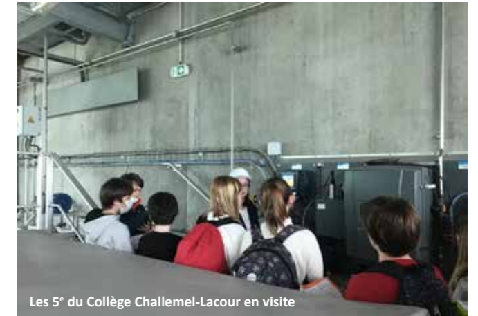
Les 5 e du Collège Challemeil-Lacour en visite