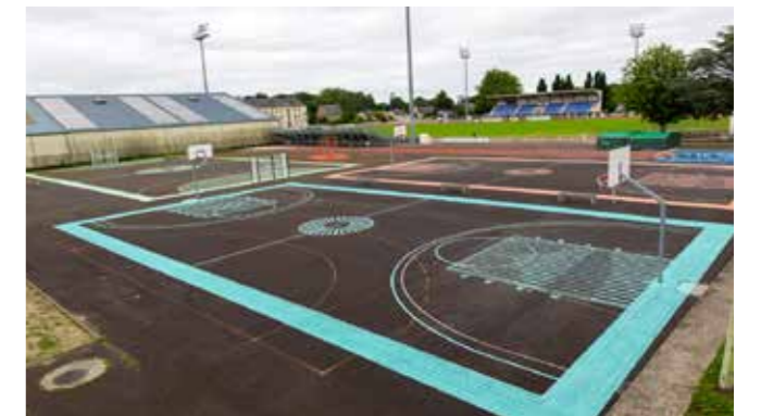
Le plateau sportif René Fenouillère a pris des couleurs

Après un travail de plusieurs mois réalisé en concertation avec les porteurs de projets et les services municipaux, plusieurs aires de jeux et structures sportives (street workout) votées au budget participatif sont installées. Le plateau René Fenouillère présente un nouveau visage, avec ses terrains repeints, son aire de street workout, ses panneaux de baskets remplacés et l'installation de mobilier urbain. Dans la Vallée de la Bourdonnière et à la Turfaudière, les équipements sportifs ouverts à tous à partir de 13 ans, adeptes du fitness, habitants comme touristes, ont été installés. Ils sont complétés de QR codes renvoyant vers une application permettant de réaliser les exercices correspondant à l'agrès choisi. Dans le Jardin des plantes, l'entrée PMR est en rénovation et le réaménagement de l'aire de jeux a débuté : les entreprises doivent se succéder pour une fin des travaux prévue mi- juillet.