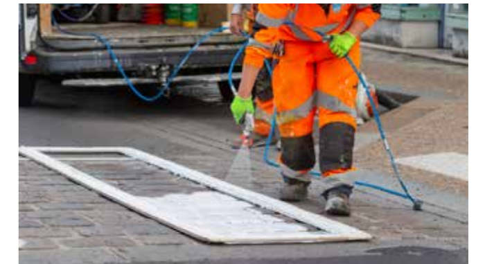
Les marquages au sol ont été rafraîchis : ils sont à nouveau bien visibles

Partout dans la commune, les agents des services techniques ont repeint les indications routières en marquage au sol. Les passages pour piétons et les limites de vitesse ne peuvent désormais plus être loupés !