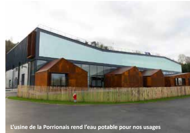
L'usine de la Porrionais rend l'eau potable pour nos usages