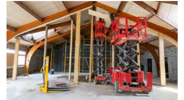
Les travaux ont débuté à la salle socioculturelle de Saint-Martin des Champs

À l'école Pierre Mendès-France, la cuisine centrale a ouvert. Les services techniques finalisent l'aménagement des locaux suite aux prescriptions des services de la Direction départementale à la protection de la population (DDPP). Les travaux du 2 e étage à l'Esc-Halles sont terminés. Les agents avancent aussi dans la réfection de bureaux en mairie. Tandis qu'à Saint-Martin des Champs, le chantier de la salle socioculturelle a débuté : les démolitions sont faites et les fondations de l'extension sont posées.