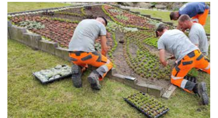
Rendez-vous au Jardin des plantes pour découvrir le papillon végétal