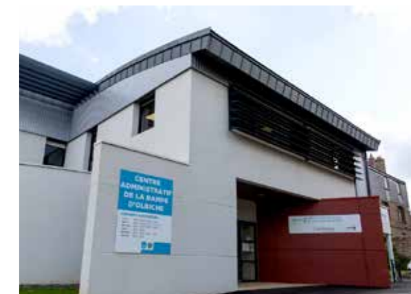
Le Centre Administratif de la Rampe d'Olbiche

Il faut anticiper, mais pas se précipiter : selon les situations, "à temps" c'est parfois... "plus tard". Les retards seront résorbés et l'État aura distribué des DR dans de nouvelles mairies. Si votre carte d'identité ne périmait que dans un an, vous pouvez encore patienter. Faites votre demande dès la rentrée si vous savez déjà que vos enfants présenteront des épreuves, type baccalauréat, en juin 2023, ou que des voyages scolaires à l'étranger sont annoncés par leur école en septembre prochain.